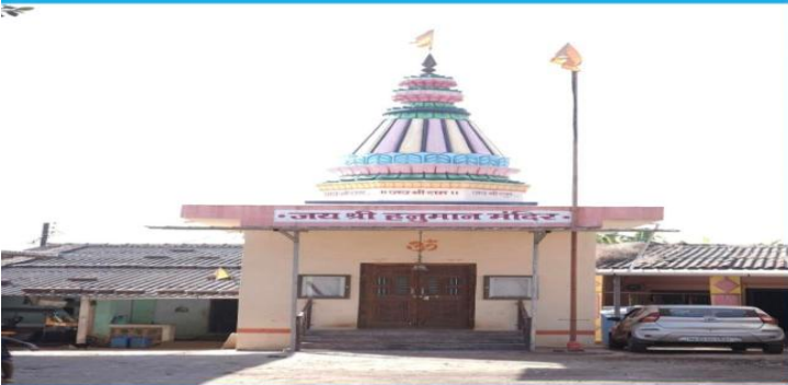
ग्रामपंचायत कासटवाडी अंतर्गत जाधवपाडा येथे नवीन श्री हनुमान मंदिर बांधकाम करण्यात आले.