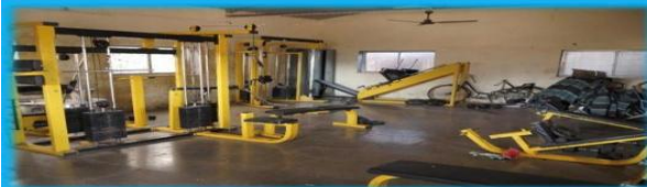
ग्रामपंचायत कासटवाडी अंतर्गत गरदवाडी येथे नवीन व्यायामशाळा बांधण्यात आली. सन-2025